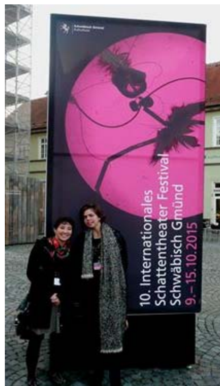
TUTU in Schwäbisch Gmünd Duitsland