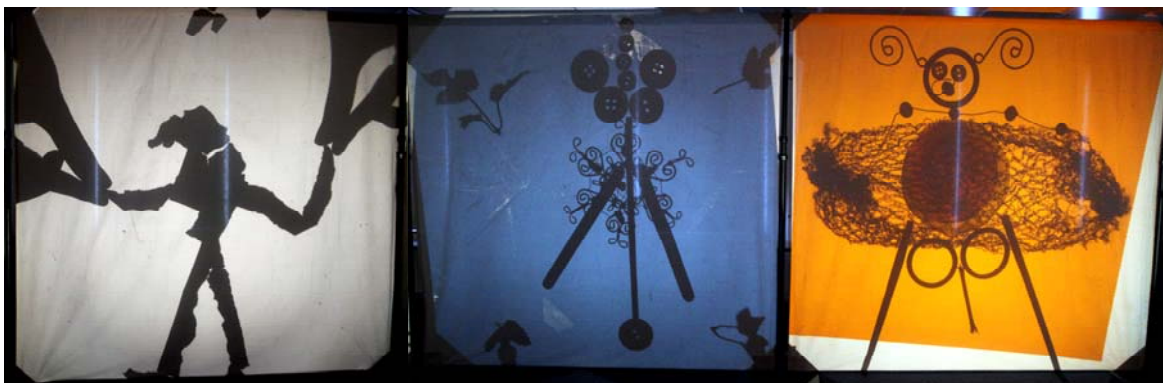
Resultaten Munduscollege Amsterdam

De resultaten van de workshops zijn gepubliceerd op de facebookpagina van Lichtbende.